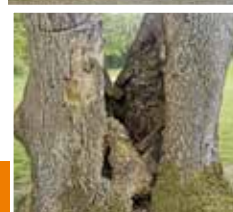
Arbres rongés à l'espace de La Maine