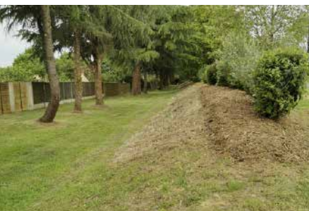
Paillage merlons entrée du bourg