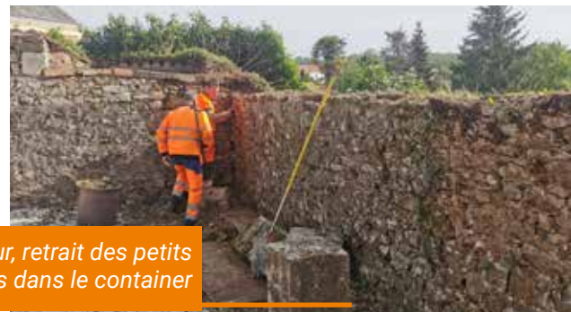
Nettoyage du mur, retrait des petits éléments stockés dans le container