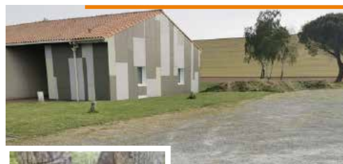
Coupe des arbres, salle Henri-Claude Guignard pour les ombrières